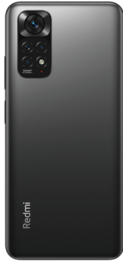
Redmi Note 11