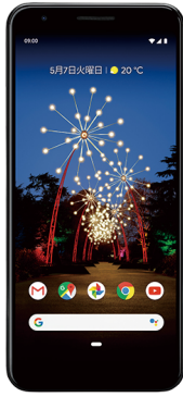
Google Pixel 3a