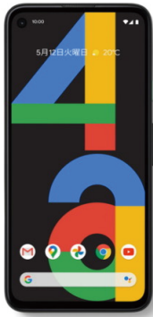
Google Pixel 4a